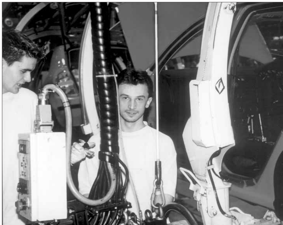
Z 26 000 zaměstnanců Škody Auto je jich přes 18 000 odborově organizovaných

Krásné prožití vánočních svátků a šťastný nový rok přejí redakce a redakční rada časopisu Kovák.