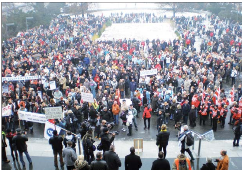
V Brně se stávkující sešli u Janáčkova divadla