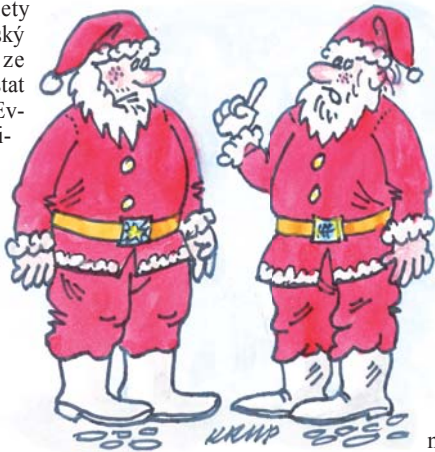
Všechno musím dohnat o Vánocích. Na Mikuláše mi nepřišel ani čert, ani anděl. Že prý stávkovali...