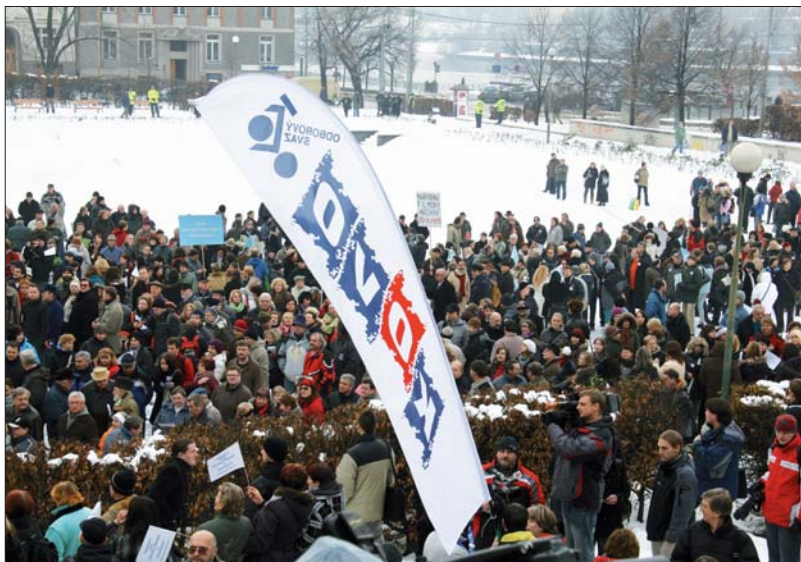
Pražský mítink se konal na Palackého náměstí a - jak vidno - zúčastnili se ho i kováci