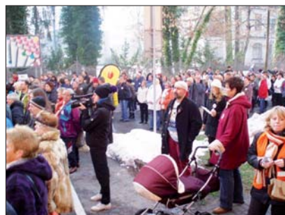
V Českých Budějovicích dorazily i rodiny s kočárky

Vážení odpovědní politici, vládo rozpočtové odpovědnosti, dnes 8. prosince 2010 se veřejně ohrazuje proti nepromyšleným změnám, odmítáme, aby platy policistů, hasičů, civilních zaměstnanců, úředníků, pracovníků ve zdravotnictví a sociálních službách, ve školství a kultuře sloužily jako rozpočtové záplaty. Odmítáme platit dluhy za špatné vládnutí!