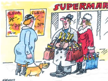
Vánoce jsme měli chudý, ale zato budeme mít letos bohatýho silvestra...