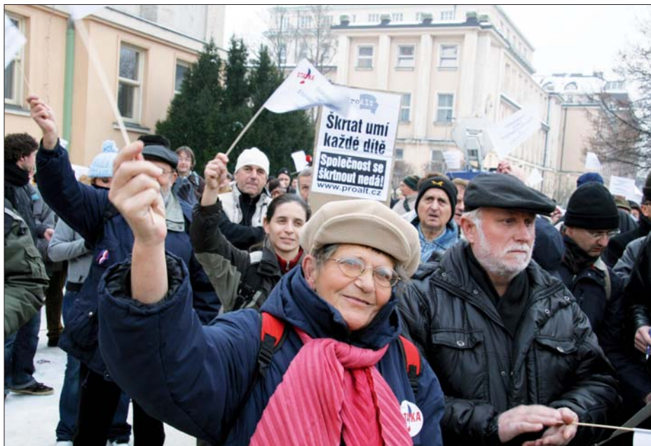
Stávku státních zaměstnanců 8. 12. podpořili svou účastí na mítincích lidé všech generací (Praha)