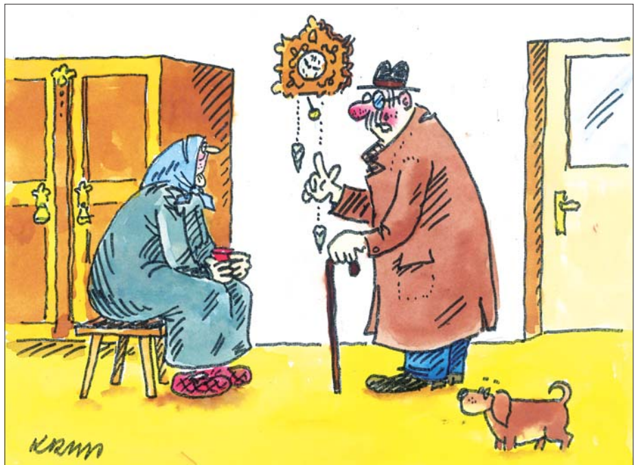
Všechno zdraží! Elektrina, plyn, topení, doprava, pečivo, maso, chleba, ovoce, zelenina... Snad nám aspoň o Vánocích povolí tu eutanazii...

Částky, které spoříte měsíčně do penzijního fondu, bylo možno alternativně ukládat na spořicí účet či jinak investovat. Takto však získáváte nárok na státní příspěvek a na výnos, kterého dosahuje vámi zvolený penzijní fond. Z penzijního připojištění se státním příspěvkem náleží buď penze, nebo jednorázové vyrovnání. Nárok vzniká splněním podmínek ve smlouvě. Ve smlouvě může být sjednána též pozůstalostní penze.