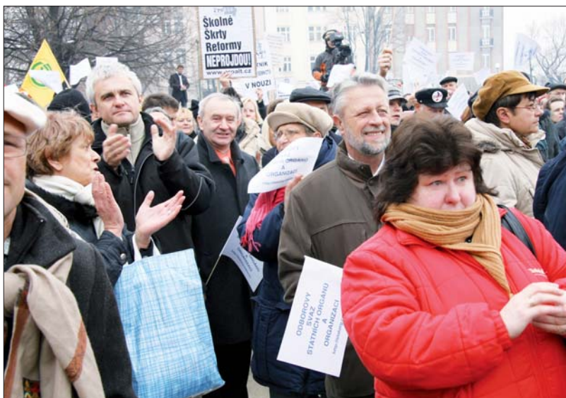
Ozdobou každé správné akce jsou vtipná hesla a nápisy