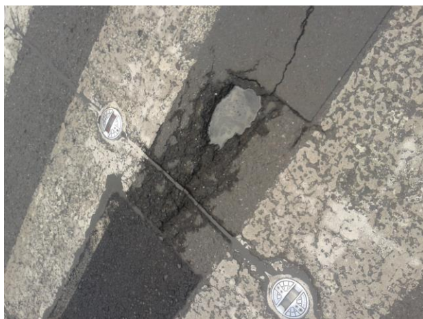
Přechod pro chodce u vysokých pecí