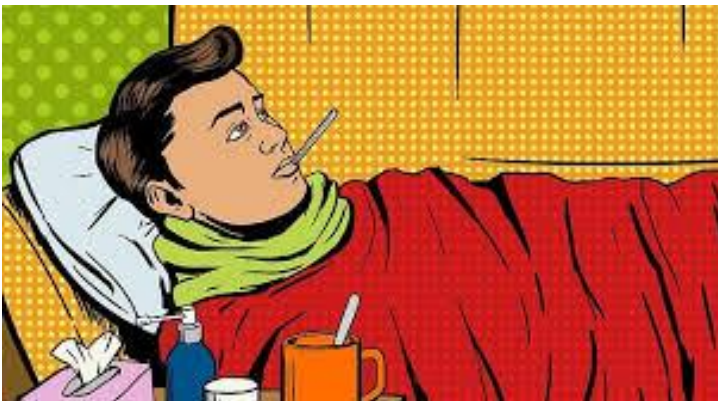
Pokr.ze str. 3

Zaměstnavatelé žádali odsunutí jednání o proplácení prvních tří dnů nemoci do doby, než se začnou plošně využívat elektronické neschopenky. Lékaři by je měli začít vystavovat od ledna 2019. Ministerstvo práce nyní navrhuje, aby se projekt v zákoně zrušil a připravil se nový. E-neschopenky by se tak zavedly od ledna 2021.