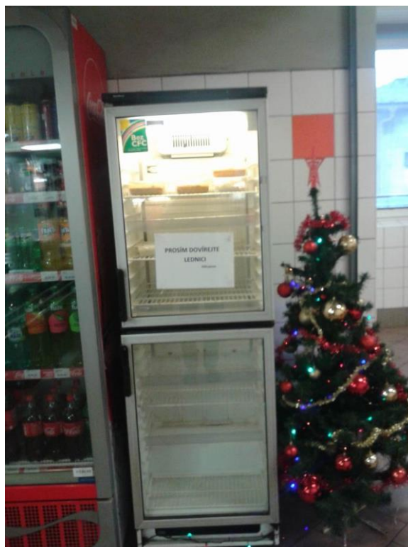
U snědeného krámu