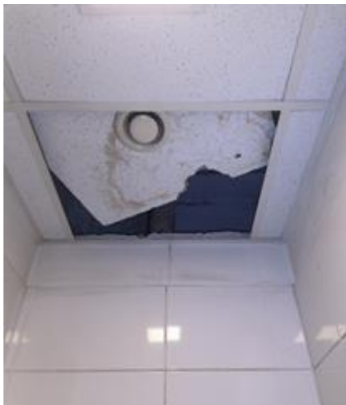
Vrchní patro je tam teplo, když je ovšem déšť a začne se rosit, kape ti za krk a je to prima.

Spodní patro K14, tam je to super, jedno topení nejde a druhé nestačí vytopit místnost a také kape za krk, utržen práh od té doby co vyletěl ventil topení a vytopil komplet celé patro. Na toaletě je mínus. Okna profukují, takže když udeří větší mrazy, toaleta je nepoužitelná. Vše hlášeno, je to tak od března letošního roku.