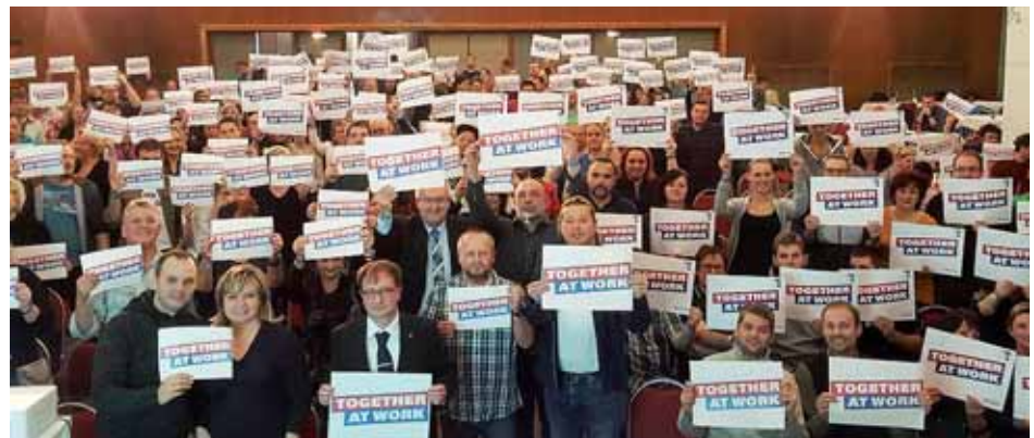
Kováci z Automotive Lighting v Jihlavě na členské schůzi 23. 11. podpořili evropskou kampaň Together at Work.

Velká Británie – odbory Unite publikovaly články v britských novinách a aktivně provádějí kampaň i v souvislosti s prosincovými volbami. (jom)