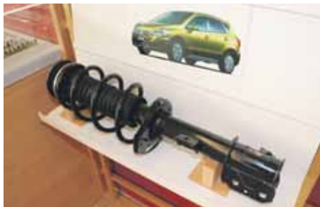
Tlumiče z čivického závodu využívají světoznámé automobilky.

Odboráři v KYB Manufacturing Czech, s.r.o., mají za sebou už dvě vyjednané kolektivní smlouvy. Za svůj podstatný úspěch po-