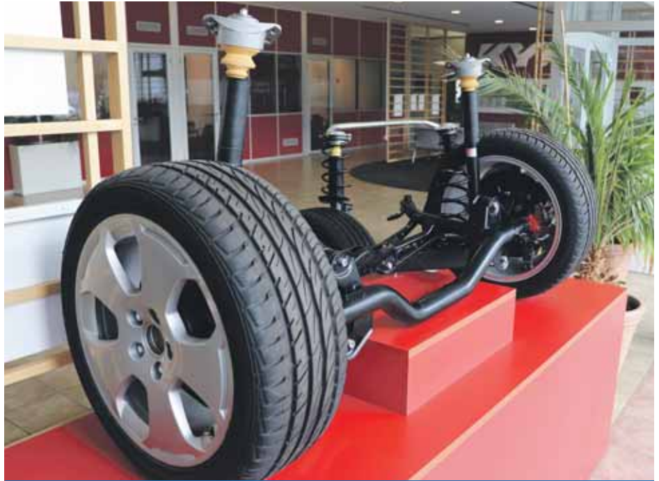
Japonská společnost KYB patří mezi největší výrobce automobilových tlumičů na světě.

važují příspěvní k urovnání napjaté situace v podniku. Podařilo se jim vyjednat zvýšení tabulkových mezd především pro níže kvalifikované pracovníky, což pomůže stabilizovat například obsluhu na linkách a snížit velkou fluktuaci, která podnik sužuje. Zaměstnanci se mohou těšit na celoplošné zvýšení mezd o čtyři procenta, příplatky na dopravu nebo příplatky za noční směny a za práci o víkend. Finanční benefity mezi členy odborů rozdělí i místní ZO.