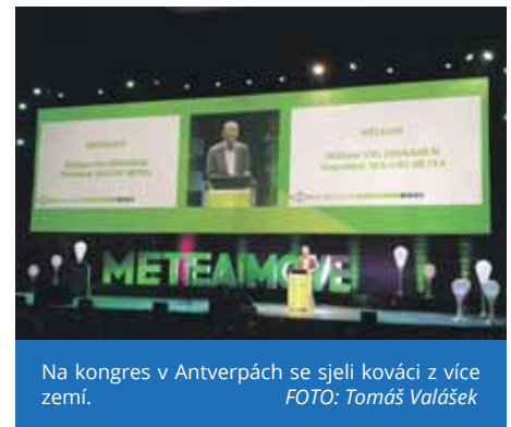
Na kongres v Antverpách se sjeli kováci z více zemí.

nejenom to, jak jsou v Belgii odbory silné, ale taky to svědčí, že si zaměstnavatel uvědomuje, že odbory jsou pro něj užitečné," uzavírá místopředseda Valášek. (jom)