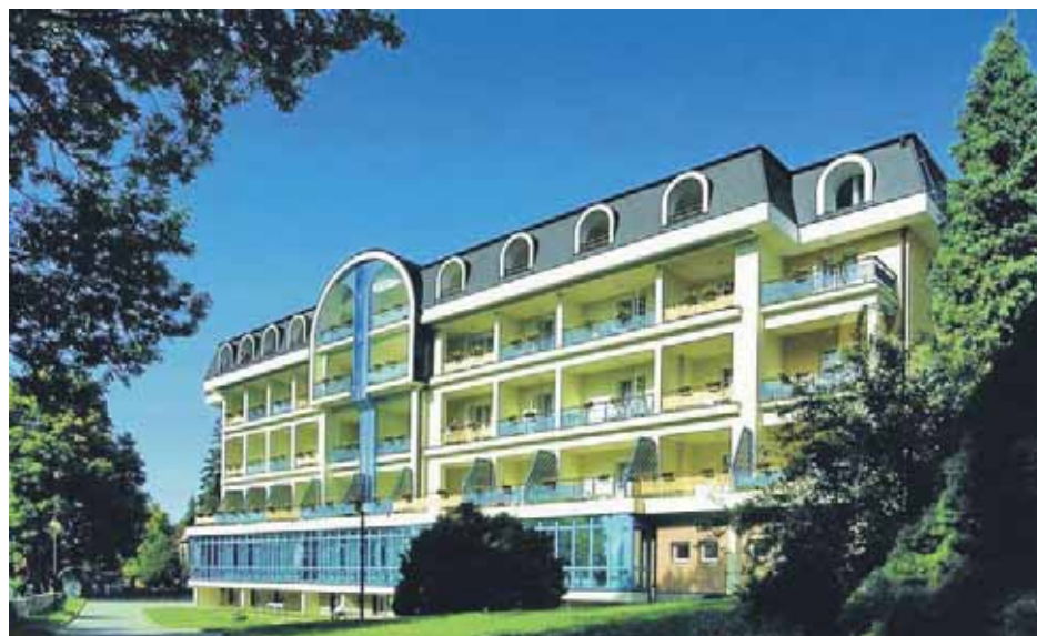
Moderní lázeňský hotel Bezuř s výhledem na hlavní hřeben Hrubého Jeseníku nabízí kovákům zvýhodněné relaxační pobyty.

Aktivita OS KOVO v nabídce služeb se neomezuje pouze na domácí prostředí, nově došlo k uzavření spolupráce v oblasti benefitů s partnerským odborovým svazem OZ KOVO na Slovensku. „Se slovenskými kováky máme domluveno využití hotelové sítě společnosti SOREA. Po předložení průkazu OS KOVO tam budou moci naši odboráři využít stejné slevy jako slovenští