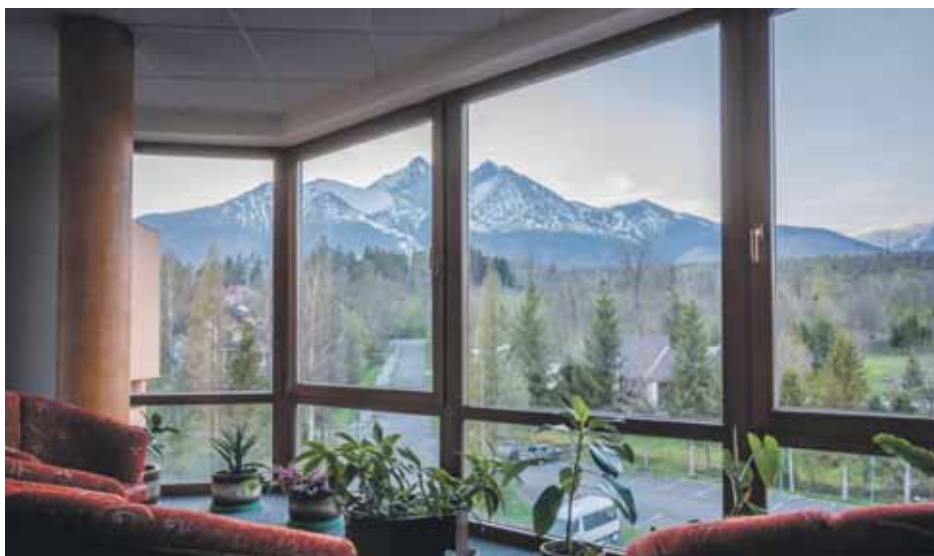
Nově budou kováci mít možnost využívat slevu ve slovenské síti hotelů SOREA.

„Portál Tipli.cz , který je lídrem na našem trhu v oblasti takzvaného Cashback (vrácení peněz z nákupu), nabízí členům OS KOVO po registraci možnost nákupu se slevou ve více než tisícovce ověřených e-shopů. Tipli.cz těmto registrovaným zákazníkům po nákupu zboží vrátí část ceny na jejich účet. Na Tipli.cz se za posledních osm měsíců registrovalo více jak 330 členů OS KOVO, kteří takto ušetřili 50 000 korun. Bližší informace o Tipli.cz a ostatních benefitech jsou zveřejněny na intranetu OS KOVO v oddělení Služby členům. Naše nabídka benefitů je tedy velká, stále se rozšiřuje a kováci mají z čeho vybírat,“ uzavírá místopředseda OS KOVO Tomáš Valášek.