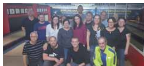
Budějovičtí kováci jsou dobrá parta.