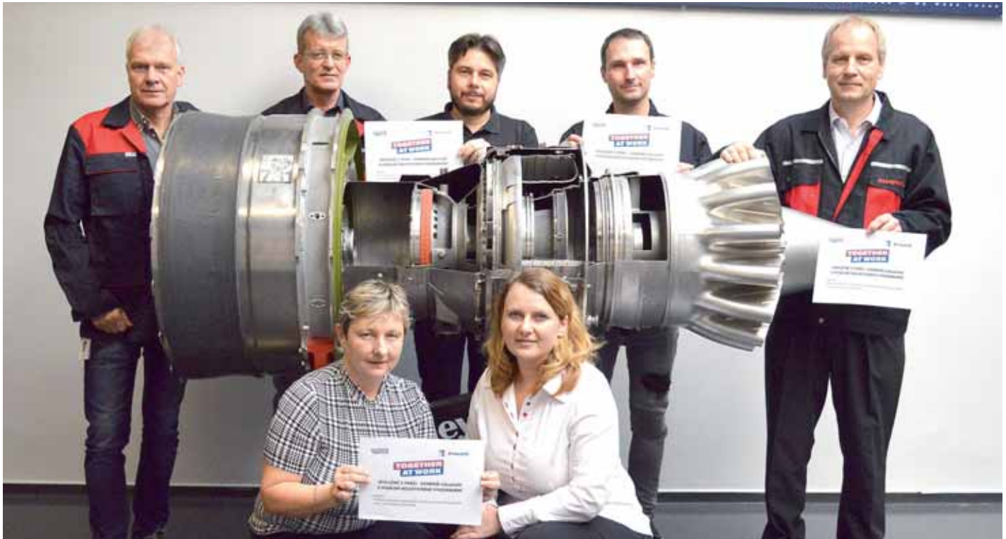
Ve společnosti Honeywell Aerospace v Olomouci kreativně spojili kolektivní vyjednávání s evropskou kampaní. Na snímku zapózovali společně s odboráři i generální ředitel a ředitel a ředitelka HR.

Během necelých tří měsíců se už kampaň na podporu kolektivního vyjednávání „Together at work“ úspěšně rozšířila v řadě evropských zemí. Akce evropské odborové centrály industriAll Europe oficiálně odstartovala 26. září. Kampaň je slyšet také v České republice díky Odborovému svazu KOVO, který ji silně podporuje a zapojil do ní svá regionální pracoviště i základní organizace. Odborová centrála industriAll zveřejnila na svých stránkách togetheratwork.eu interaktivní mapu s údaji o jednotlivých zemích a průběhu propagace kolektivního vyjednávání na národních úrovních.