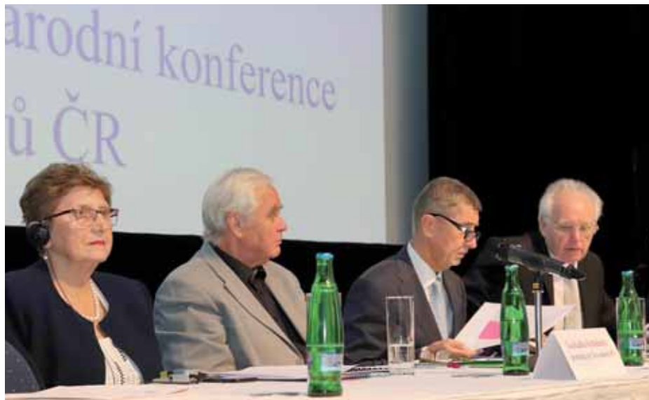
Mezinárodní konference seniorských organizací se zúčastnil také premiér Andrej Babiš.

„Každý občan by měl mít právo podílet se na rozhodování,“ prohlásil na konferenci Dirk Jarré, prezident Evropské federace se-