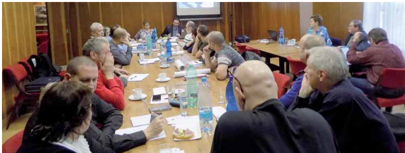
Pracovníci RP OS KOVO Zlín se pravidelně účastní konferencí Krajského sdružení OS KOVO Zlínského kraje.

Na závěr mi dovoluji popřát všem pohodové svátky vánoční, hodně zdraví, štěstí, osobní a pracovní pohody v roce 2020.