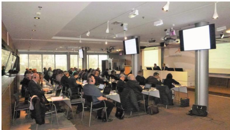
Foto: VÝROČNÍHO JEDNÁNÍ ARCELORMITTAL EWC Mj. se hovořilo o BOZP, budoucnosti záměrů, koupi italské ILVA, investicích, emisních povolenkách, digitalizaci, plánu do roku 2020 postavit v Luxembourgu nové sídlo AM.