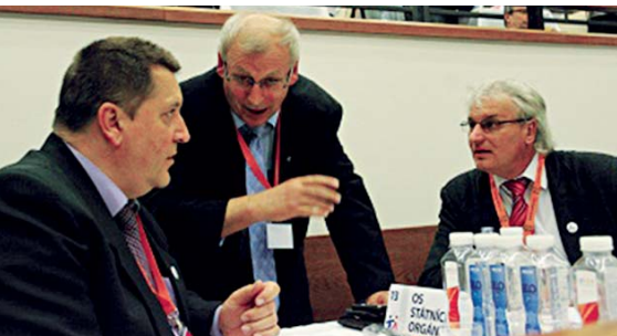
Živé debaty probíhaly i o sjezdových přestávkách