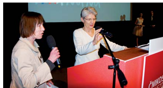
„Volte sociální Evropu!“ vyzvala účastníky sjezdu Bernadette Ségol, generální tajemnice Evropské odborové konfederace (na snímku vpravo)

V souvislosti s nutností nastartování dalšího hospodářského růstu proto Bernadette Ségol vyzdvihla důležitost nadcházejících voleb do Evropského parlamentu (EP). Evropský parlament může udělat mnoho pro růst investic do infrastruktury, vědy, vývoje, vzdělávání, tvorbu nových pracovních míst. Je však nutno odmítnout požadavky euroskeptiků, kteří říkají, že bude lépe bez EU. Vyzvala přítomné, aby věnovali volbám pozornost a volili poslance, kteří budou v Evropském parlamentu prosazovat sociální Evropu,