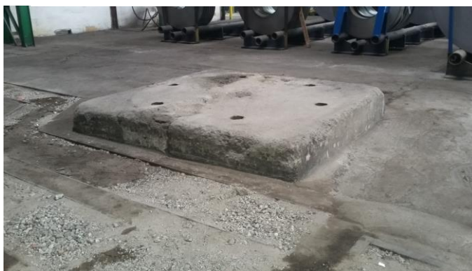
Nechtělo by to alespoň ošrafovat ?