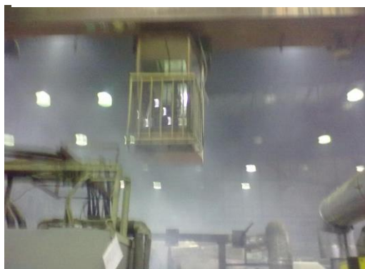
Pro nedostatečné odsávání ze svařovacího stroje ani foťák není schopen zaostřit!