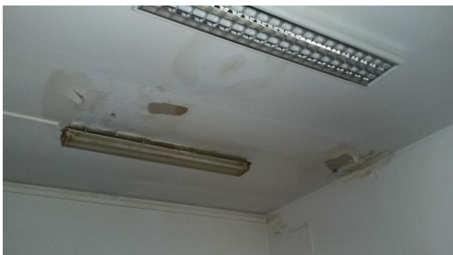
Strop v jídelním koutku...teče voda teče....

Bohužel i takové jsou záběry z našich sociálek a pracovišť. Doufáme jen, že se začnou řešit konkrétní závady a ne kdo toto fotil!