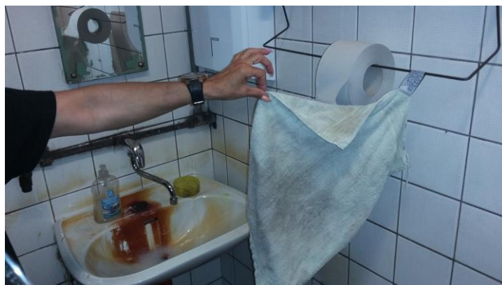
Dámské WC na provozu, bez teplé vody