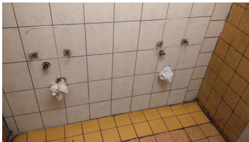
Pisoáry někdo odvezl, prý ucpané staré potrubí, že by definitivní řešení?