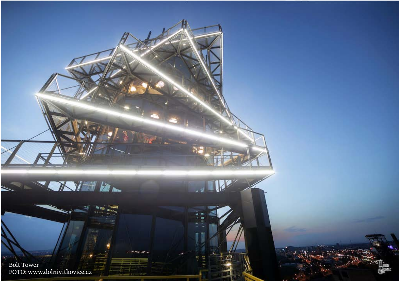
Bolt Tower

Protest, kterému je věnována hlavní část tohoto Kováka, se konal v oblasti Dolní Vítkovice. Ne každý zná historii této národní kulturní památky zapsané v seznamu Evropského kulturního dědictví nebo to, co nabízí. Rozsáhlý průmyslový areál Vítkovických železáren s unikátním souborem industriální architektury leží poblíž centra Ostravy ve Vítkovicích. Mimochodem, souboru tří na sebe navazujících celků – černouhelného dolu, koksovny a vysokopečního provozu – se prý také říkalo Ostravské Hradčany.