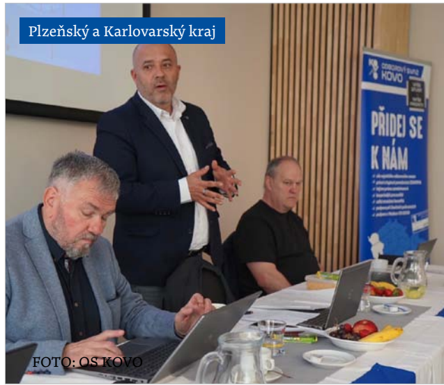
Plzeňský a Karlovarský kraj