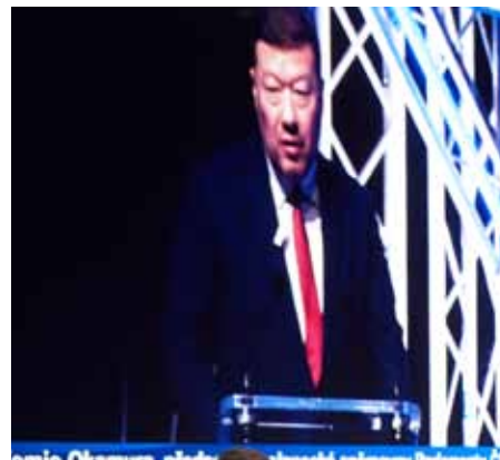
Tomio Okamura, předseda Sněmovny Parlamentu ČR