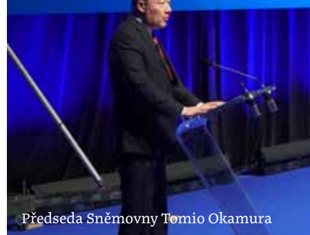
Předseda Sněmovny Tomio Okamura