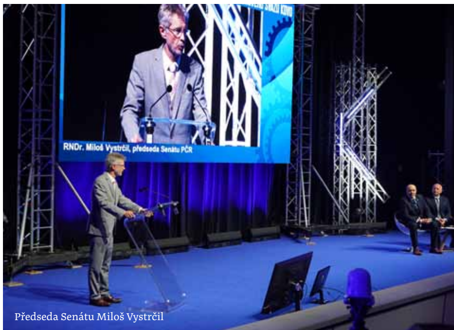
Předseda Senátu Miloš Vystrčil

změnách mohou zájemci získat na svých regionálních pracovištích. Hlavním bodem byla ale volba nového vedení.